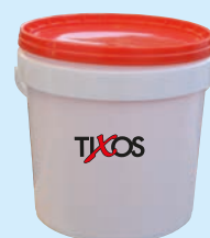
MALTA TRASPIRANTE AL LATTE-ACETO