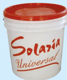
PITTURA TRASPIRANTE AL LATTE-ACETO

per Rivestimenti e Microcappotti edili di finitura: traspiranti, anti-umidità, anti-muffa, anti-smog e termoriflettenti