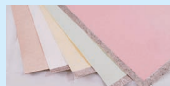
MEMBRANE TERMORIFLETTENTI AL LATTE-ACETO